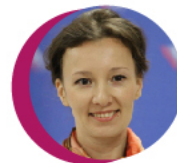
УПОЛНОМОЧЕННЫЙ ПРИ ПРЕЗИДЕНТЕ РФ ПО ПРАВАМ РЕБЕНКА АННА КУЗНЕЦОВА