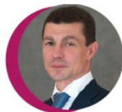
МИНИСТР ТРУДА И СОЦИАЛЬНОЙ ЗАЩИТЫ МАКСИМ ТОПИЛИН