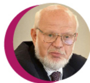
ПРЕДСЕДАТЕЛЬ СОВЕТА ПРИ ПРЕЗИДЕНТЕ РФ ПО ПРАВАМ ЧЕЛОВЕКА МИХАИЛ ФЕДOTOV