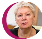
МИНИСТР ОБРАЗОВАНИЯ И НАУКИ РФ ОЛЬГА ВАСИЛЬЕВА